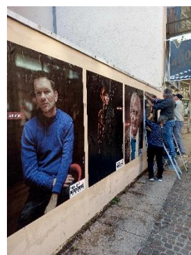
Exposition photos de Dominik Fusina des précédentes éditions

Quant à l'exposition des affiches des lycéens, celles-ci étaient cette fois visibles sur un écran numérique installé dans la chapelle des Echevins, allumé au moment des buffets. Notre partenaire Eval Bureautique a pu fournir ce grand écran interactif d'excellente qualité, avec lequel nous