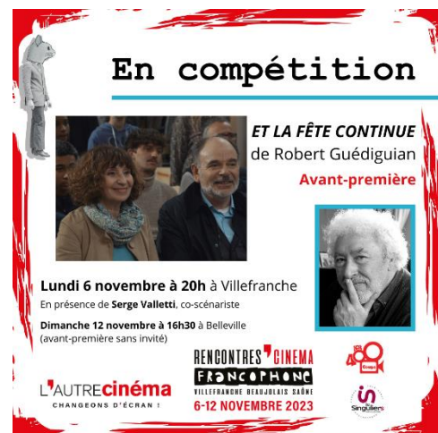
Visuel type pour réseaux sociaux (Facebook et Instagram)

Sujet Le journal des Rencontres - Jour 2 !