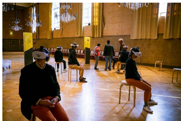
Espace de Réalité Virtuelle en salle des Echevins

Matthieu van Eeckhout a le plus plu et certaines personnes ont visionné les trois films.