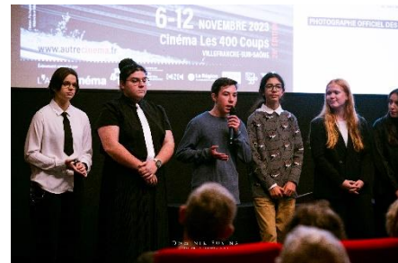
Lycéens annonçant le prix pour Avant que les flammes ne s'éteignent à la cérémonie de clôture

Pour continuer à renforcer la qualité de ce projet, il a été décidé comme habituellement de préparer les élèves en amont des journées de projections. Des membres de l'Autre Cinéma se sont donc rendus dans les trois lycées afin de présenter l'association et la ligne éditoriale des Rencontres.