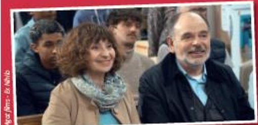
Et la fête continue* de Robert Guédiguian.