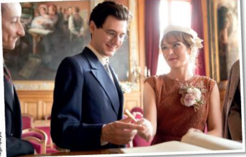
Le Temps d'aimer de Katell Quillévéré.