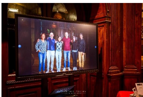
Ecran interactif fourni par Eval Bureautique avec une photo du jury