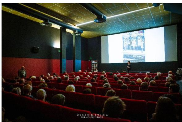
Soirée de clôture avec les lycéens annonçant le prix du jury