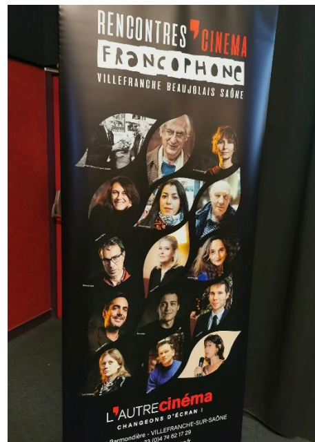
Nouveau roll-up des Rencontres du cinéma francophone