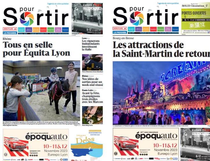
Manchettes dans le supplément Pour Sortir du journal Le Progrès (couverture Rhône et Ain), vendredi 3 novembre 2023