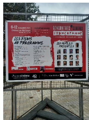
Triptyque sur la Place des Arts de Villefranche

Sans oublier les panneaux sucettes Decaux municipaux qui ont accueilli 24 affiches (couverture sur 3 réseaux) pendant une semaine à la fin du mois d'octobre.