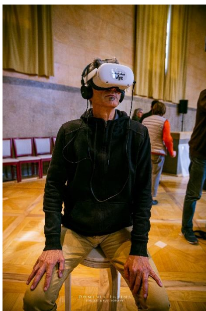
L'ex-directeur du cinéma Les 400 Coups perdu dans un nouvel univers...

Les bénévoles ont été formés au préalable par Festivals Connexion et ont donc pu accueillir le public avec aisance, sans problèmes informatiques majeurs. L'expérience et les films ont été très appréciés par un public de tous âges (pas seulement les plus jeunes mais aussi beaucoup de personnes de plus de 50 ans).