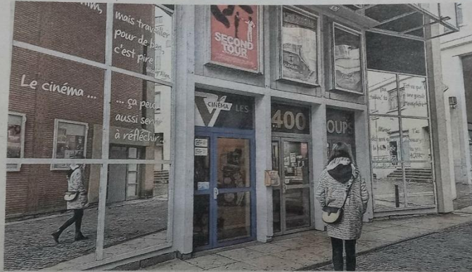
Des temps forts se dérouleront au cinéma Les 400 Coups, situé à Villefranche-sur-Saône.

À ne pas manquer au cinéma Les 400 Coups : la soirée d'ouverture, lundi 6 novembre, à 20 heures, avec la projection du film Et la fête continue de Robert Guédiguian, en pré-