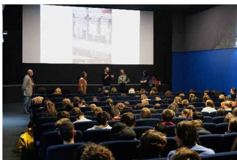
Projection lycéens de L'Etoile Filante d'Abel et Gordon en leur présence

Plus de 245 lycéens (une année record), de la seconde à la Terminale se sont constitués jury pour élire le film lauréat du prix des lycéens parmi 4 films en compétition. Les projections se sont déroulées sur deux jours (mardi 7 et jeudi 9 novembre) sur le temps scolaire. Notons cette année la présence de la 1 ère spécialité Arts Plastiques du lycée Claude Bernard, qui réalisera l'affiche des 29 èmes Rencontres l'an prochain. Une volonté de leur faire vivre le festival aux premières loges afin que les élèves captent l'essence des Rencontres.