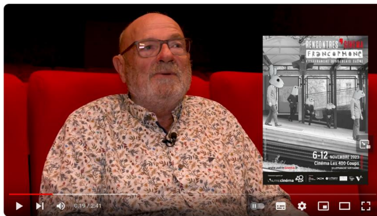
Cinéma - Les rencontres du cinéma Francophone 2023