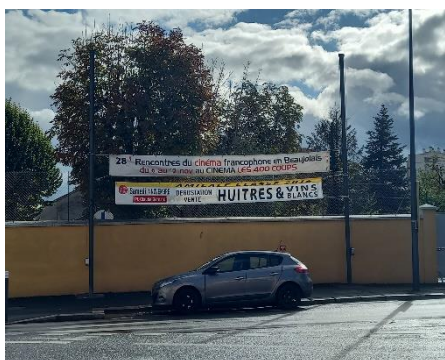
Banderole rue Roncevaux à Villefranche-sur-Saône

Comme les années précédentes, une campagne d'affichage sur triptyques de la municipalité de Villefranche a pu être mise en place : un triptyque annonçant la sortie du programme le 13 octobre a donc été installé près de la mairie fin septembre/début octobre. Sur la place des Arts, nous avons pu faire installer le triptyque habituel avec 1 face permanente reprise des éditions précédentes et deux autres actualisées afin de présenter les invité.e.s des 28èmes Rencontres.