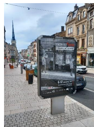
Affiche Decaux dans la rue Nationale