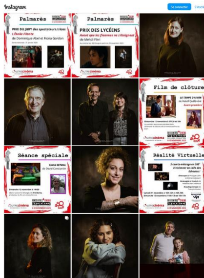
Extrait de la page Instagram de L'Autre Cinéma alimentée régulièrement par la bénévole Catherine Antoine